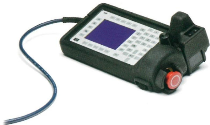
ABB S4C, S4CPlus Bumper